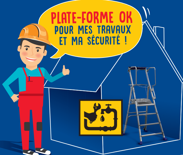
PLATE-FORME OK POUR MES TRAVAUX ET MA SÉCURITÉ !